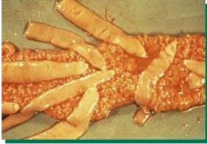
Bilde viser bendelorm i siste delen av tynntarmen

I en norsk undersøkelse basert på slaktehusmateriale fant Ihler og medarbeidere en forekomst av bendelorm på 26% på Østlandet og ca. 7% i Trøndelag. I materialet sås ingen tegn til immunitetsutvikling mot infeksjonen. Infeksjonen er langt hyppigere blant hester som har gått på gamle permanente beiter. Jordmiddene trives best her, og det er derfor på slike beiter smitte mulighetene er størst. Det ser ikke ut til at bendelormen smitter i vesentlig grad ved bruk av innmarksbeite. Ut fra den kunnskapen en har i dag er det fornuftig å behandle alle dyr som har gått på permanente beiter (beiter som i fem år eller mer årlig til hest) spesifikt mot bendelorm senhøstes.